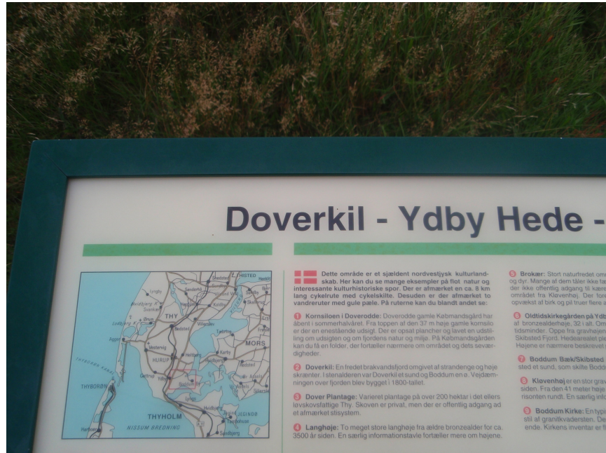
Et skilt som dokumentation fra OZFF-011