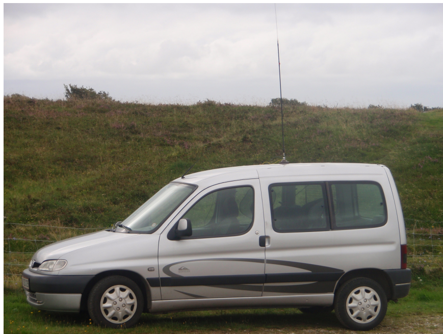
Antenne m.m. som dokumentation fra OZFF-011

I mailen skal man også skrive hvilken OZFF man har aktiveret samt hvilket call man har brugt. En godt idé er også at skrive det i subjekt linjen – eks ”OZFF-011 OZ7AEI/P log”